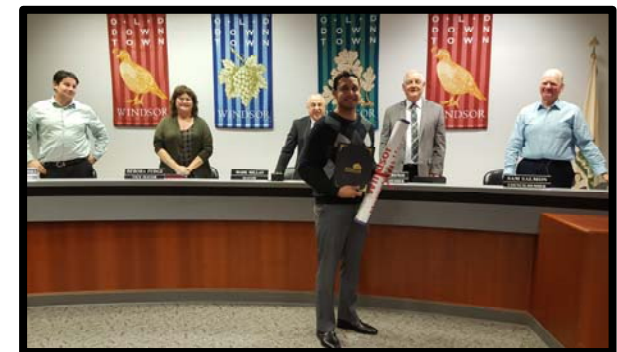
Retiro Militar de la bandera de Héroes Locales