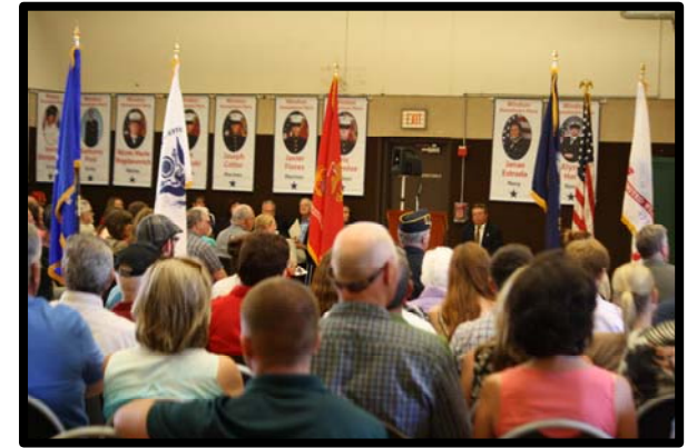
Ceremonia Militar de la bandera de Héroes Locales

Tener a un miembro inmediato de la familia trabajando ó con residencia en el área de Windsor (esposo/a, padre, madre, abuelo/a, hermano/a, hijo/a, tía ó tío).